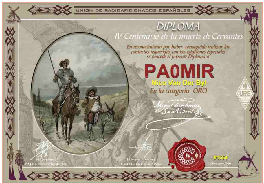
Cervantes - Goud