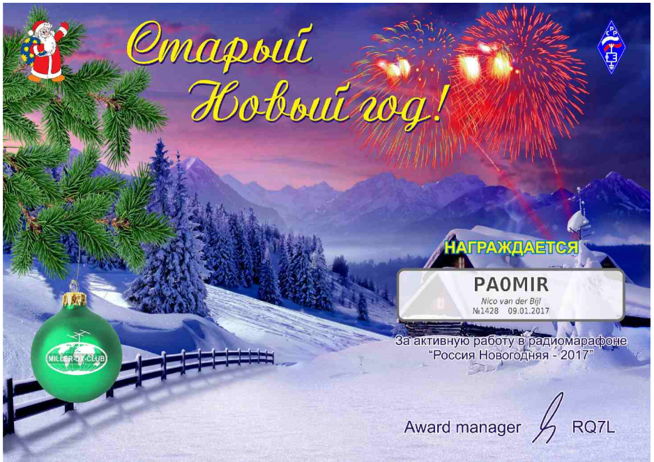
Oudjaar - Nieuwjaar 2017